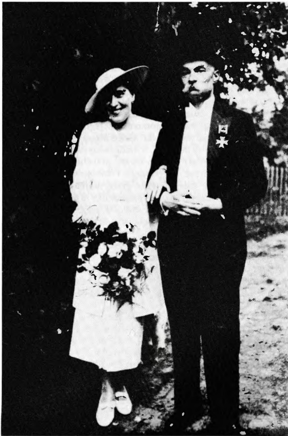
Ryc. 1. Zdjęcie ślubne autora wspomnień, Czernichów Górny — czerwiec 1936 r.